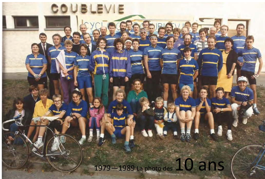
1979—1989 La photo des 10 ans

A Voiron, le TGV Grenoble - Paris percute un convoi exceptionnel bloqué au passage à niveau du boulevard Denfert-Rochereau : 2 morts (le conducteur du train et un passager). Depuis, le trafic routier passe sous les voies ferrées.